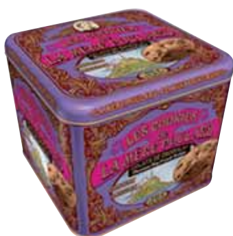
40569. Coffret Collector cookies éclats de chocolat