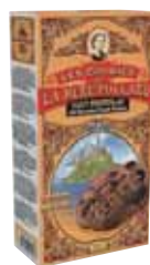
40571. Etui Collector cookies tout chocolat