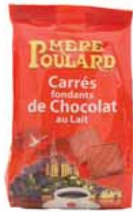
50024. Carrés de chocolats au lait