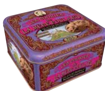
40570. Demi-coffret Collector cookies éclats de chocolat