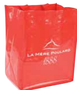
50238. Sac collector rouge