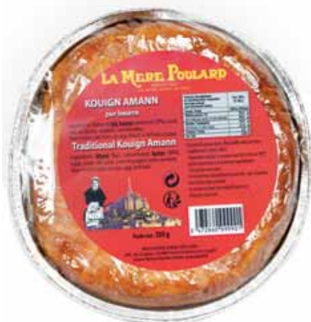
50062. Kouign amann