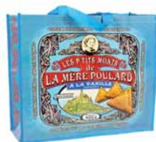
50154. Sac collector bleu