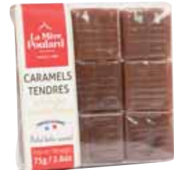
50250. Mini étui de caramels pâtisiers