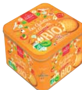
40726. coffret fer galettes d'Annette