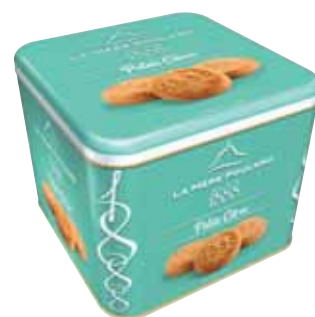
40542. Coffret 1888 palets au citron