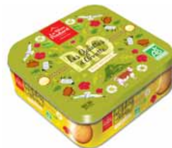
40714. Demi-coffret fer galettes d'Annette bio pur beurre 183.3g,