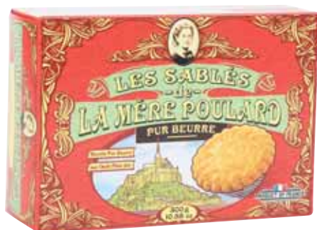
40059. Boîte carton Collector sablés