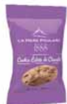
40511. Carton de 100 sachets pocket de cookies éclats de chocolat