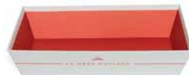
50182. Corbeille petit modèle