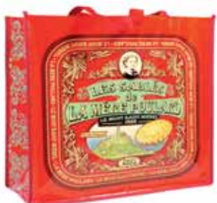
50150. Sac collector rouge