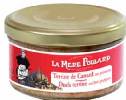
50206. Terrine de canard au piment d'Espelette