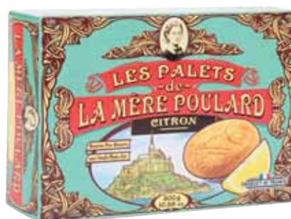
40452. Boîte carton Collector palets citron