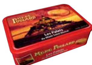
40093. Boîte à sucre Mont Saint Michel palets