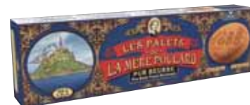
40592. Etui Collector palets