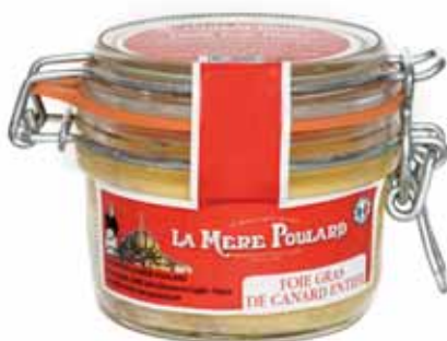
50110. Foie gras de canard entier