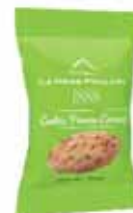
40515. Carton de 100 sachets pocket de cookies pomme caramel x 1