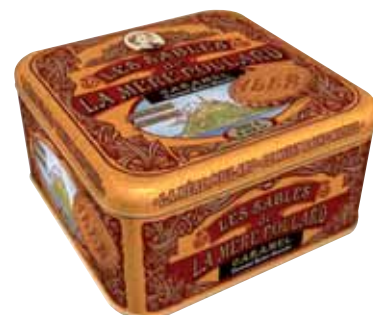
40558. Demi-coffret Collector sablés au caramel