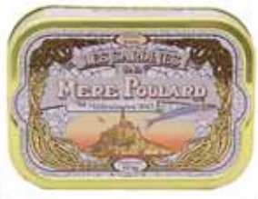
50109. Sardines millésimées à l'huile d'olive (blanc)