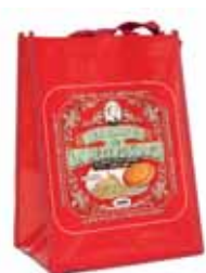
50189. Petit sac collector rouge