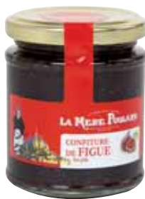
50070. Confiture Figue