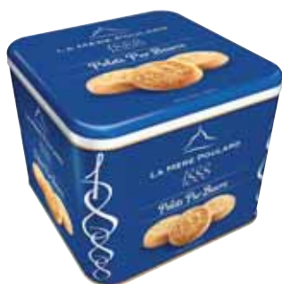
40540. Coffret 1888 palets