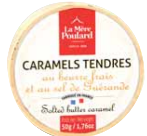
50038. Boîte camembert de caramels