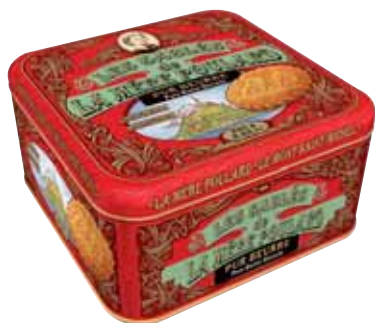
40075. Demi-coffret Collector sablés