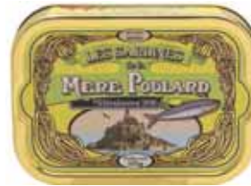
50214. Sardines millésimées à l'huile d'olive (jaune citron)