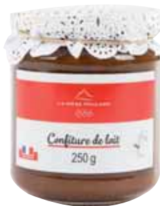
50065. Confiture de lait