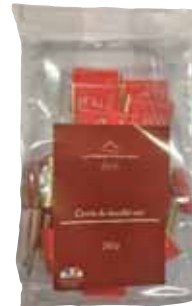
50023. Carrés de chocolats noir