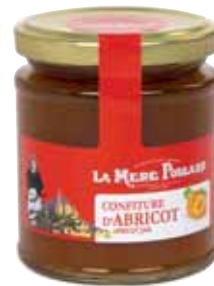
50068. Confiture Abricot