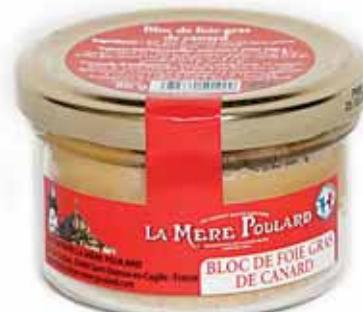
50190. Bloc de foie gras de canard