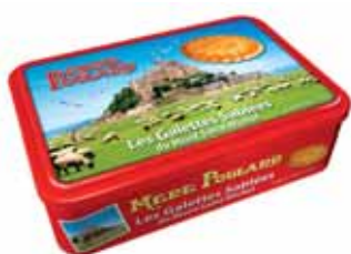
40091. Boîte à sucre Mont Saint Michel sablés