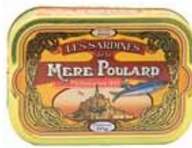
50108. Sardines millésimées à l'huile d'olive (jaune)