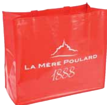
50239. Sac collector rouge