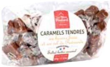
50037. Coussin de caramels