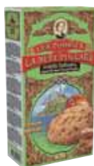
40574. Etui Collector cookies pomme caramel