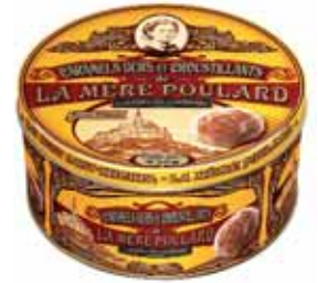
50055. Boîte fer de caramels durs et croustillants