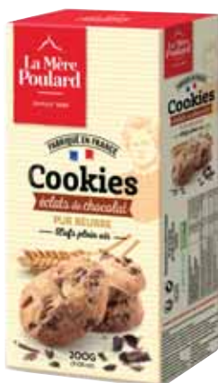
40512. Etui cookies éclats de chocolat