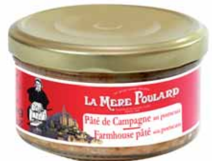
50204. Pâté de campagne au pommeau