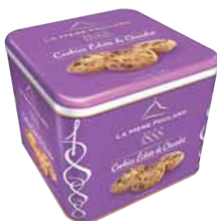
40549. Coffret 1888 cookies éclats de chocolat