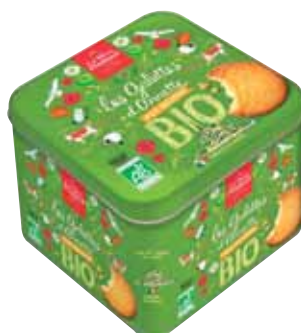
40713. Coffret fer galettes d'Annette bio pur beurre 366.6g