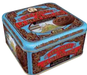
40565. Demi-coffret Collector palets tout chocolat