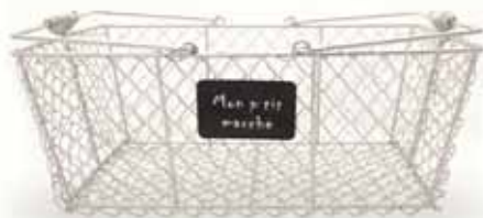
50137. Panier « Mon p'tit Marché » grand modèle