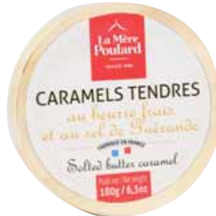
50249. Boîte camembert de caramels