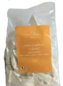
550027. Céréales croustillantes au chocolat saveur praliné 87g