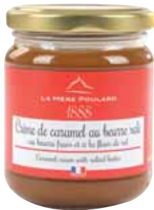
50033. Crème de caramel