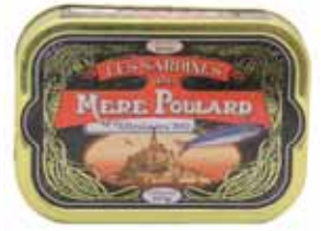
50104. Sardines millésimées à l'huile d'olive (noir)