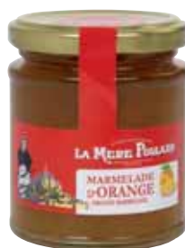
50074. Marmelade Orange Amère