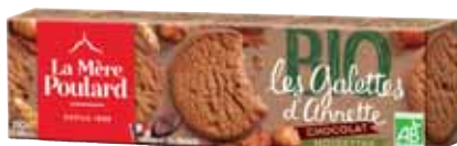
40650. Etui galettes d'Annette chocolat - noisettes