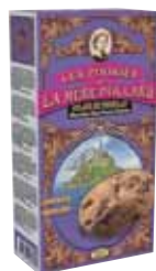
40568. Etui Collector cookies éclats de chocolat