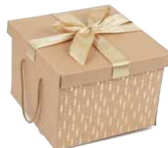
Référence CP120G Coffret Ruban carton