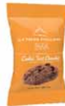
40513. Carton de 100 sachets pocket de cookies tout chocolat x 1