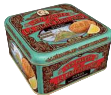
40450. Demi-coffret Collector palets citron