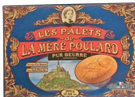
40061. Boîte carton Collector palets