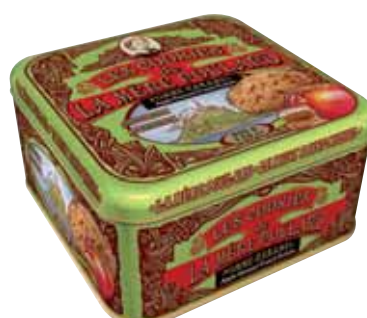
40576. Demi-coffret Collector cookies pomme caramel