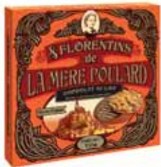
50192. Etui de florentins au chocolat au lait