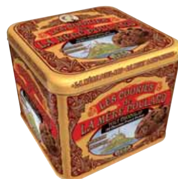
40572. Coffret Collector cookies tout chocolat