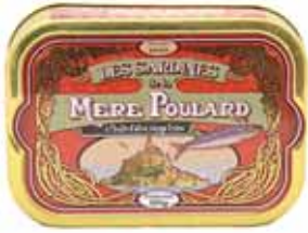
50103. Sardines à l'huile d'olive (rouge)