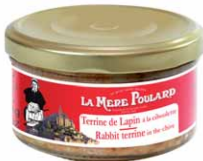
50205. Terrine de lapin à la ciboulette