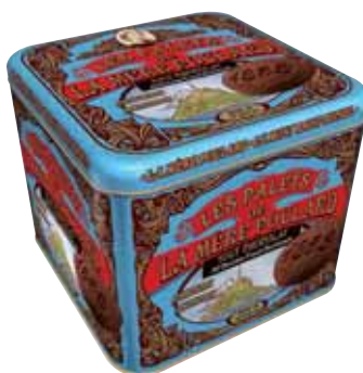
40564. Coffret Collector palets tout chocolat