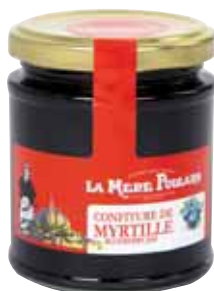
50073. Confiture Myrtille