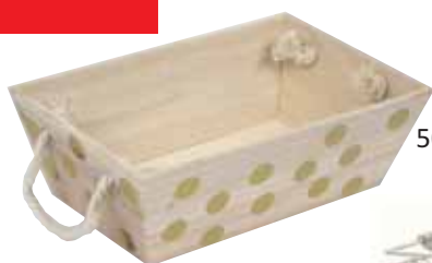
50133. Corbeille bois