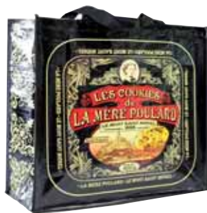
50148. Sac collector noir