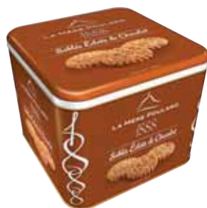
40538. Coffret 1888 sablés éclats de chocolat