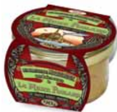
50201. Rillettes de maquereaux aux baies rose