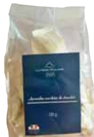
50022. amandes enrobées de chocolat au lait 105g