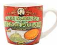
50123. Mug décor collector rouge