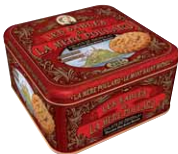
40562. Demi-coffret Collector sablés éclats de chocolat