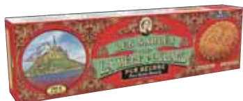
40591. Etui Collector sablés