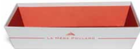
50181. Corbeille grand modèle