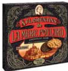
50193. Etui de florentins au chocolat noir