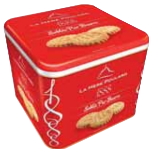
40531. Coffret 1888 sablés