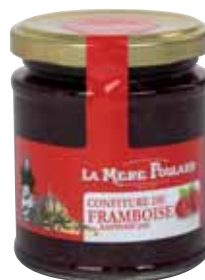
50071. Confiture Framboise