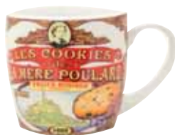
50128. Mug décor collector blanc