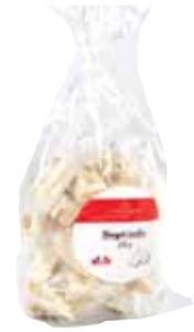
50057. Sachet de nougats