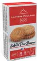
40530. Demi-étui sablés