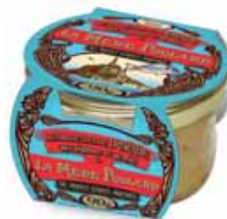
50200. Rillettes de dorade aux oignons et au miel