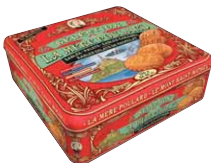
40457. Coffret assortiment de sablés, sablés caramel, sablés éclats de chocolat et palets