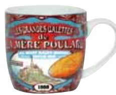
50184. Mug décor collector bleu