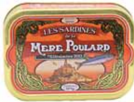
50106. Sardines millésimées à l'huile d'olive (orange)