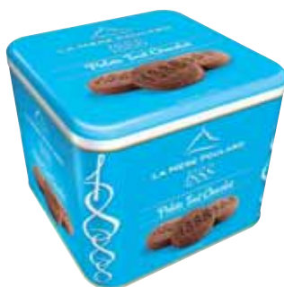
40545. Coffret 1888 palets tout chocolat