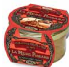
50197. Rillettes de fruits de mer au Curry