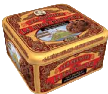
40573. Demi-coffret Collector cookies tout chocolat