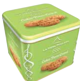
40553. Coffret 1888 cookies pomme caramel