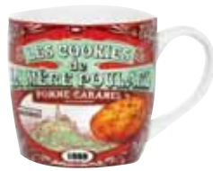
50183. Mug décor collector marron