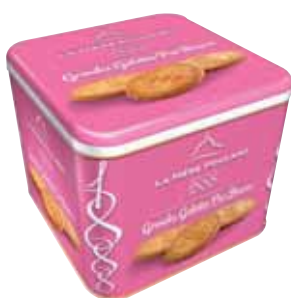
40547. Coffret 1888 grandes galettes