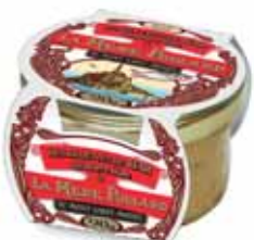
50199. Rillettes de bar au beurre blanc