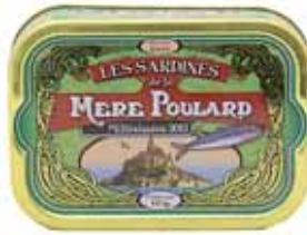
50107. Sardines millésimées à l'huile d'olive (verte)