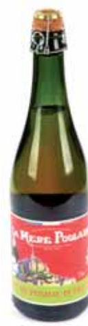
50020. Jus de pomme pétillant