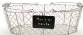
50136. Panier « Mon p'tit marché » petit modèle