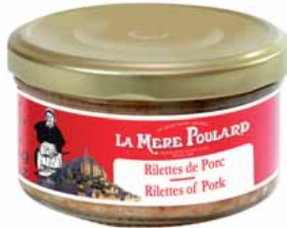
50203. Rillettes pur porc