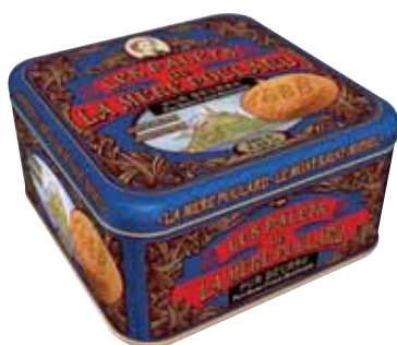
40077. Demi-coffret Collector palets