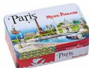
40107. Boîte à sucre Paris sablés