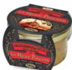
50195. Rillettes de moules marinières