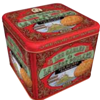
40083. Coffret Collector sablés