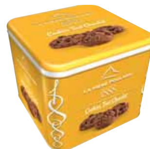
40551. Coffret 1888 cookies tout chocolat