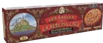
40559. Etui Collector sablés éclats de chocolat