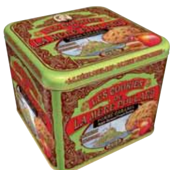
40575. Coffret Collector cookies pomme caramel