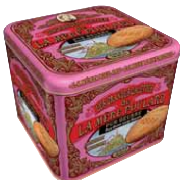
40566. Coffret Collector grandes galettes