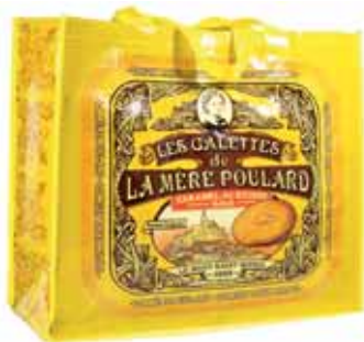
50147. Sac collector jaune