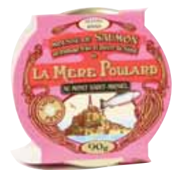
50240. Mousse de saumon fumé au fromage frais et poivre du Népal