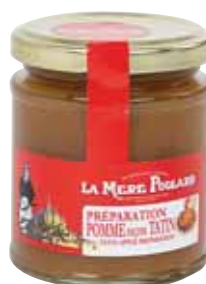
50077. Confiture Pomme Tatin