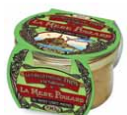
50198. Rillettes de thon à la salicorne