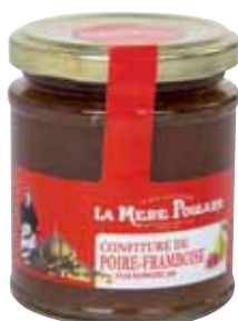
50076. Confiture de Poire/Framboise