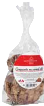
50032. Sachet de craquants