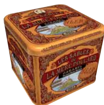
40557. Coffret Collector Sablés au caramel