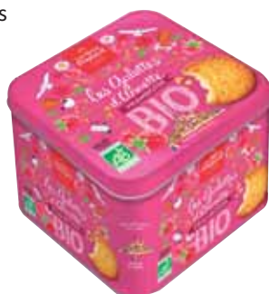
40725. coffret fer galettes d'Annette bio à la framboise 333.3g