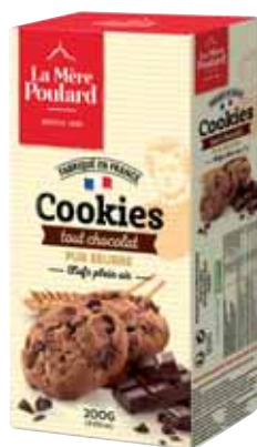
40514. Etui cookies tout chocolat