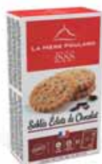
40537. Demi-étui sablés éclats de chocolat