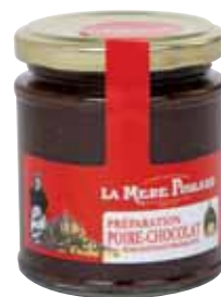
50075. Confiture Poire/Chocolat