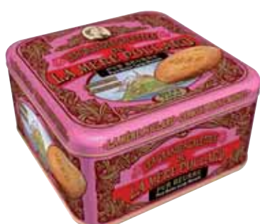
40567. Demi-coffret Collector grandes galettes