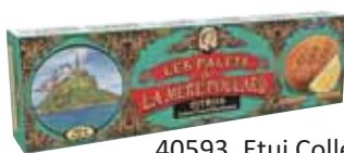
40593. Etui Collector palets au citron