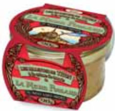
50194. Rillettes de thon à la crème de tomate