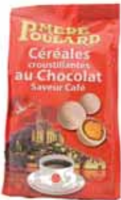
50026. Céréales croustil- lantes au chocolat saveur