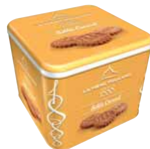
40534. Coffret 1888 sablés au caramel