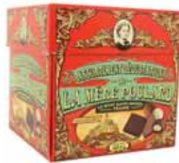
50028. Boîte tulipe assortiment de chocolats