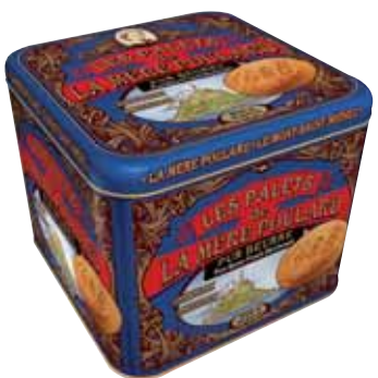
40085. Coffret Collector palets