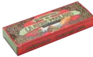
50191. Etui de 10 sucettes au caramel