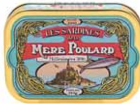
50211. Sardines millésimées à l'huile d'olive (bleu)