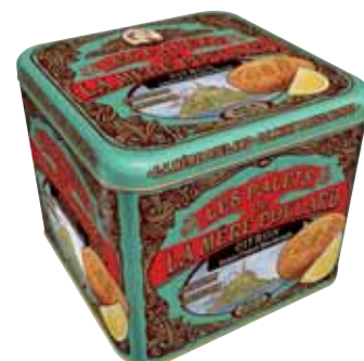
40451. Coffret Collector palets au citron