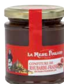
50078. Confiture Rhubarbe/Fraise