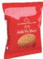
40595. Carton de 120 sachets pocket de sablés