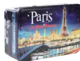
40470. Boîte à sucre Paris by night sablés