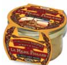
50196. Rillettes de sardines au beurre de baratte