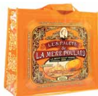
50149. Sac collector orange