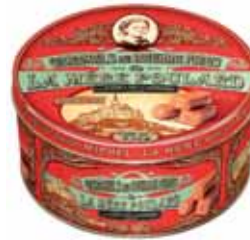
50054. Boîte fer de caramels au beurre salé