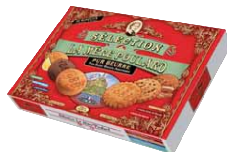
40646. Boîte carton Collector assortiment