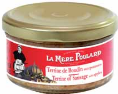
50202. Terrine de boudin aux pommes