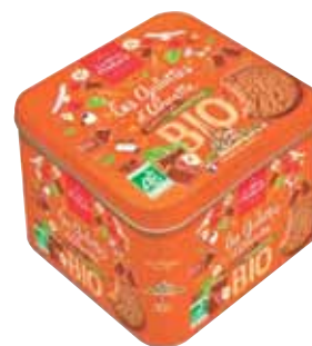
40724 coffret fer galettes d'Annette chocolat noisette 366.6g