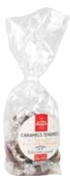
50035. Sachet de caramels