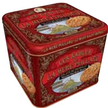
40561. Coffret Collector sablés éclats de chocolat