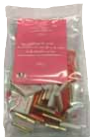
50025. mélange de carrés de chocolat noir et au lait 200g