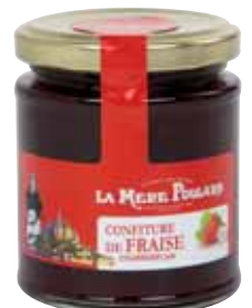
50072. Confiture Fraise