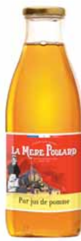
50019. Jus de pomme