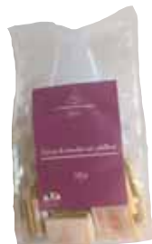
50251 carrés de chocolat noir pétillant 200g