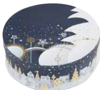
référence BF371P Boîte ronde carton