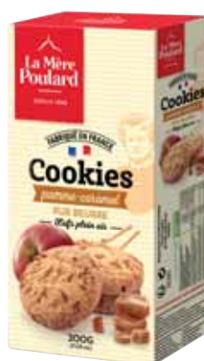
40516. Etui cookies pomme caramel