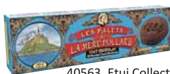
40563. Etui Collector palets tout chocolat