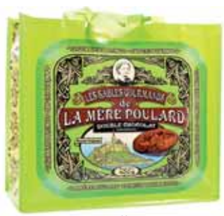
50152. Sac collector vert