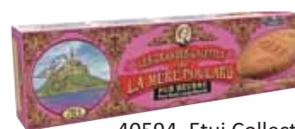
40594. Etui Collector grandes galettes