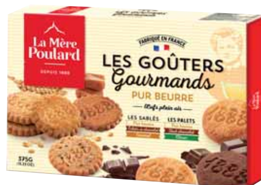
40643. Boîte carton de goûters gourmands