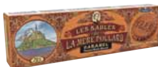
40556. Etui Collector sablés au caramel