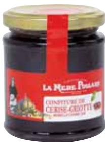
50069. Confiture Cerise Griotte