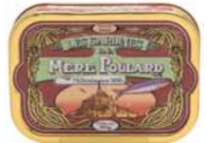
50210. Sardines millésimées à l'huile d'olive (marron)