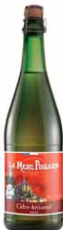
50003. Cidre doux artisanal