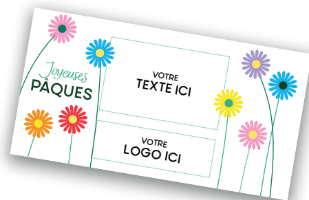
CARTE MESSAGE PERSONNALISÉE 0.80€ TTC par unité