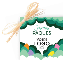
ÉTIQUETTE PERSONNALISÉE 0.80€ TTC par unité