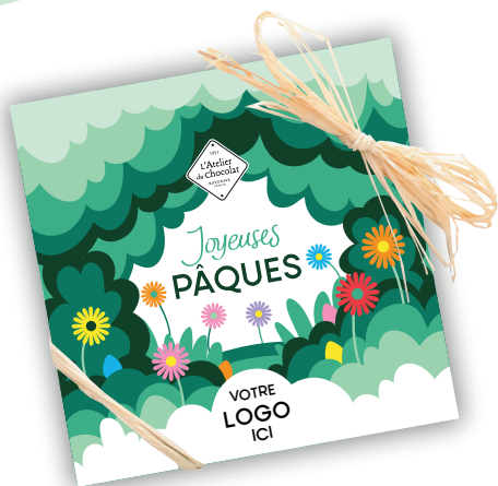
COUVERCLE PERSONNALISÉ POUR LES COFFRETS ILBARRITZ OU SUR LES CARRÉS JOYEUSES PÂQUES 1.50€ TTC par unité

Offre dédiée aux professionnels, hors commandes groupées. Minimum de commande 20 unités par personnalisation.